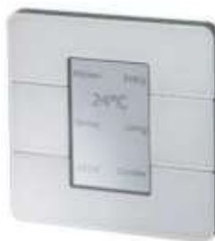
Philips Antumbra Display