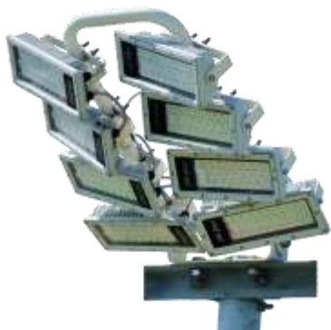
Lumosa CS 840 Pro / CS 860 Pro