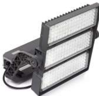
Philips BVP527 HGB